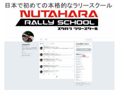
日本で初めての本格的なラリースクール